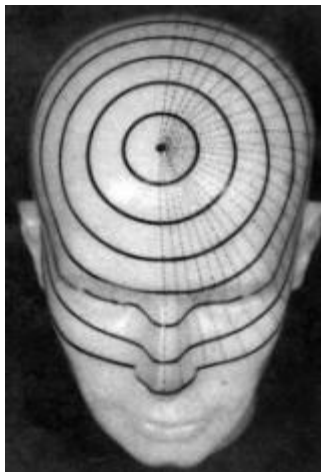
De energetische kringen van de transmitter relays op het hoofd.

energievelden, die aan de realisering van individuele levensprogramma's bijdragen", is de vaste overtuiging van deze Duitse esotiek-pionier.